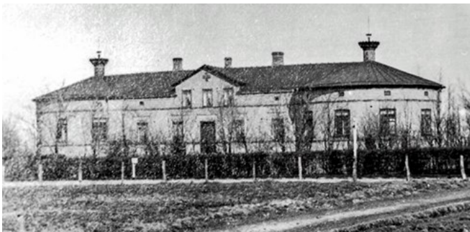
Höganäsbolaget visade intresse för sociala frågor. Sjukhusvård fanns på sjukhuset i Bjuv. Det var byggt på 1880-talet med två runda tornavdelningar sammanbundna med en lång korridor där Dilot hade mottagning och tillsammans med en sjuksköterska ansvarade för inlagda patienter.