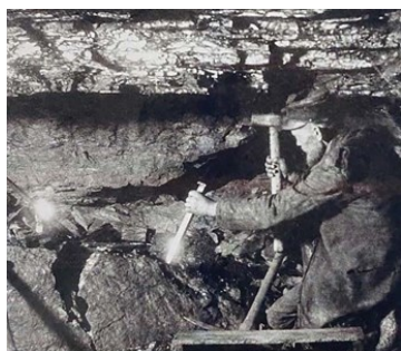
Gruvarbetare med gruvhacka, slägga och huggmejsel.

Trots dålig arbetsmiljö och stor olycksrisk ansågs arbetet i gruvorna fritt och bra jämfört med lantarbetet. Fördelarna var god lön och bättre arbetstider. En ny samhällsklass bildades, arbetarklassen.