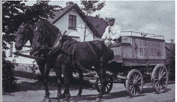
Brödutkörning med häst och vagn 1912 i Skromberga.

Bagaren körde runt och sålde bröd, mjölken kom med häst och vagn, bryggaren kom med svagdricka och fisk såldes från lådor på en kärra. Slaktare och Konsum fanns på nära håll.