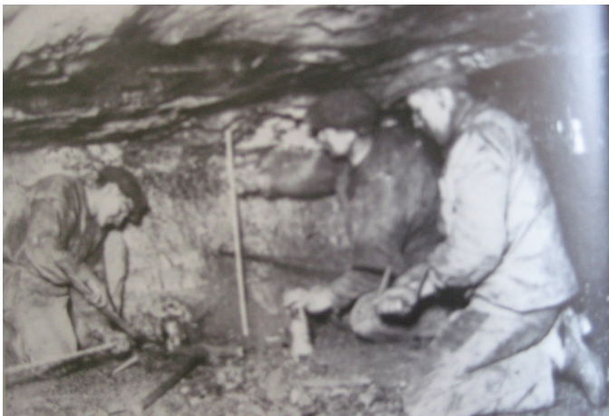
Arbetare i gruvan.