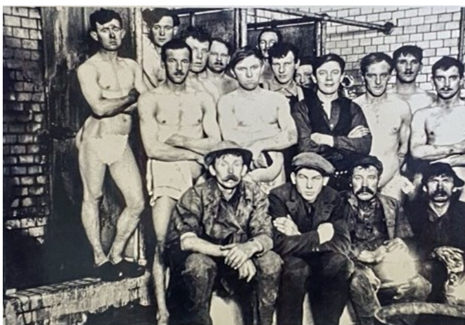
Gruppfoto i duschrummet innan tvagningen.

Arbetet som kolhuggare var hårt men det gav status och relativt hög lön.