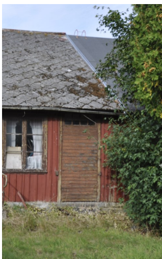
Ett bevarat gruvhus i Skromberga. Dörren är intakt från svunna gruvtider.