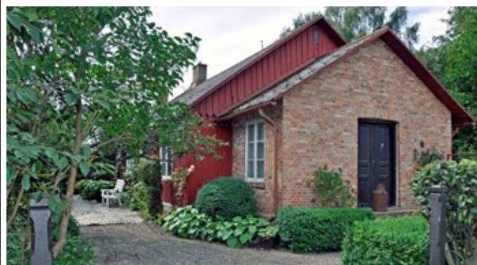
Ett välbevarat gruvhus i Ekeby.

Efterhand som åren gick slog man ihop små lägenheter till större och husen blev friköpta på 1940- och 1950-talen.