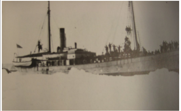
Braganza vid iskanten.

ordningen (som hade en kapacitet på 2500 ton kol per dygn). Sedan vidare färd med fartyg. Sjöfarten var mest koncentrerad till sommaren p.g.a. isen.