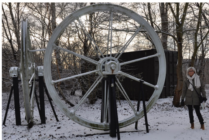
Hisshjul som drev hissarna i schakten.